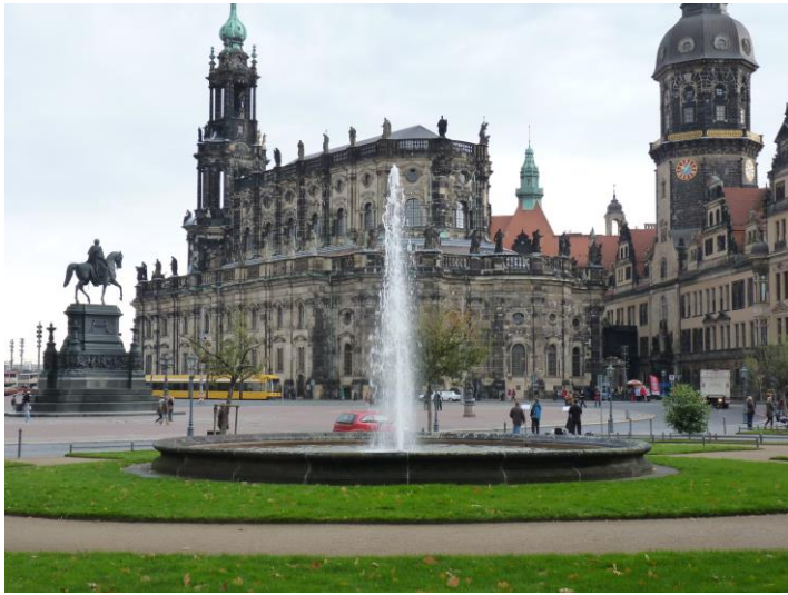
La Cathédrale et la statue de Jean de Saxe

Nous ressortons sur la place du Théâtre dominée par la haute statue équestre du roi Jean de Saxe , le meilleur traducteur de la Divine Comédie de Dante.