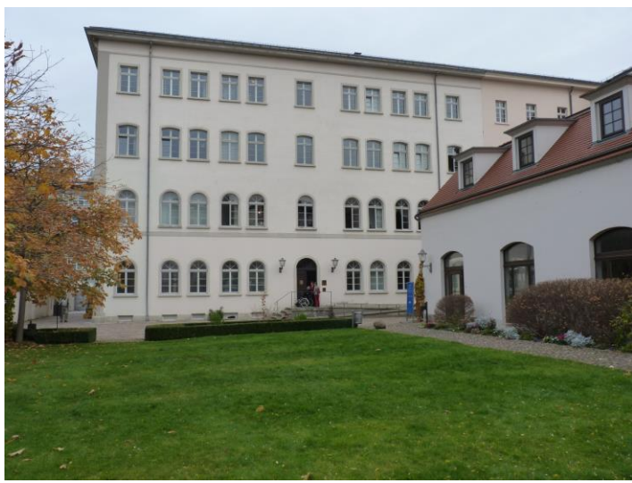
Maison de Félix Mendelssohn