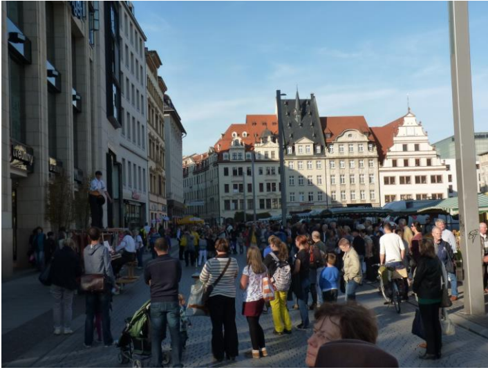
La place du marché

13 avec sa seconde. Seulement 10 atteignent la majorité !