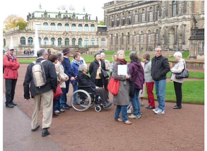
Le groupe français dans le Zwinger

A gauche de la Porte de la Couronne, nous prenons le chemin qui longe le plan d'eau pour arriver sur la place du Théâtre et entrer à nouveau dans le Zwinger par la Porte du Carillon. A gauche de cette porte une longue galerie conduit au pavillon des sciences mathématiques et physiques. Une galerie en arc de cercle relie ce bâtiment au Pavillon du Rempart le plus impressionnant du complexe. Il ne sert que de cage d'escalier monumentale pour accéder aux galeries supérieures. Il est décoré de statues de la légende grecque.