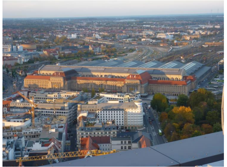
La gare centrale

Pendant que nos amis allemands font à leur tour la visite guidée de la ville, nous avons droit à un quartier libre. Notre petit groupe décide de monter sur le toit de Neues Gewandhaus (la dent de sagesse) où l'on a un magnifique panorama sur toute la ville et ses environs.