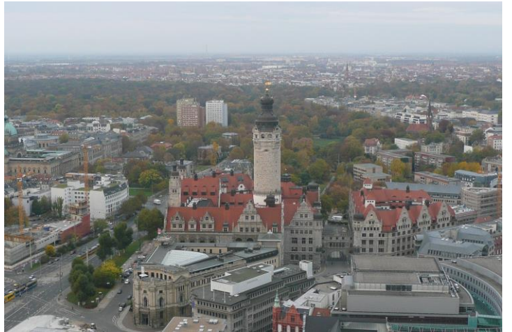
Le nouvel Hôtel de Ville