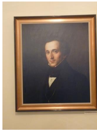
Musée des instruments de Musique

Tout le monde s'est retrouvé en début d'après-midi pour aller visiter le « Panometer Asisi ». Nous nous retrouvons dans les faubourgs de Leipzig en face d'un ancien