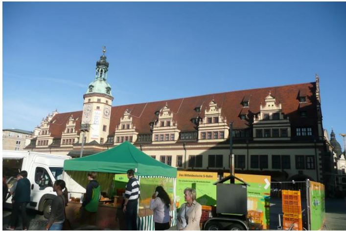
L'ancien hôtel de ville