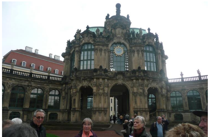
Le Glockenspielpavillon et ses 40 cloches !

A gauche de la Porte de la Couronne, un bâtiment contient une collection de porcelaines d'Extrême Orient et de Meissen qu'Auguste 1 er paya au roi de Prusse qui lui avait cédé les célèbres « Vases des Dragons ». Le Zwinger ne fut jamais habité. En 1719 une grande fête eut lieu dans la cour du Zwinger à l'occasion du mariage du fils d'Auguste le Fort avec la cousine de Marie-Thérèse d'Autriche. La sortie sur la place du Théâtre se fait par le Pavillon du Carillon dans lequel se trouve un carillon de cloches en porcelaine de Saxe. A 10 heures nous entendrons sonner le carillon sur la musique de l'Automne de Vivaldi. La musique du carillon change à chaque saison.