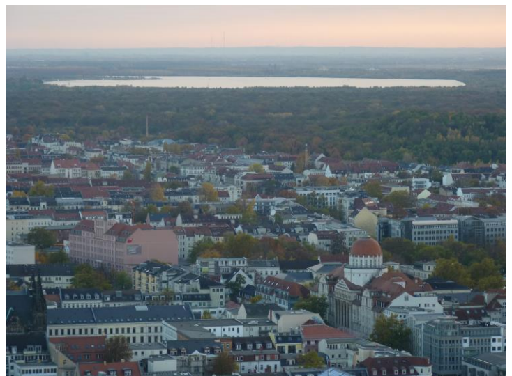
Le sud de la Ville

Cette photo montre un lac installé dans une ancienne mine exploitée à ciel ouvert : Le Neuseeland. Nous avons ensuite décidé de visiter la Maison de Félix Mendelssohn puis le musée des instruments de musiques.